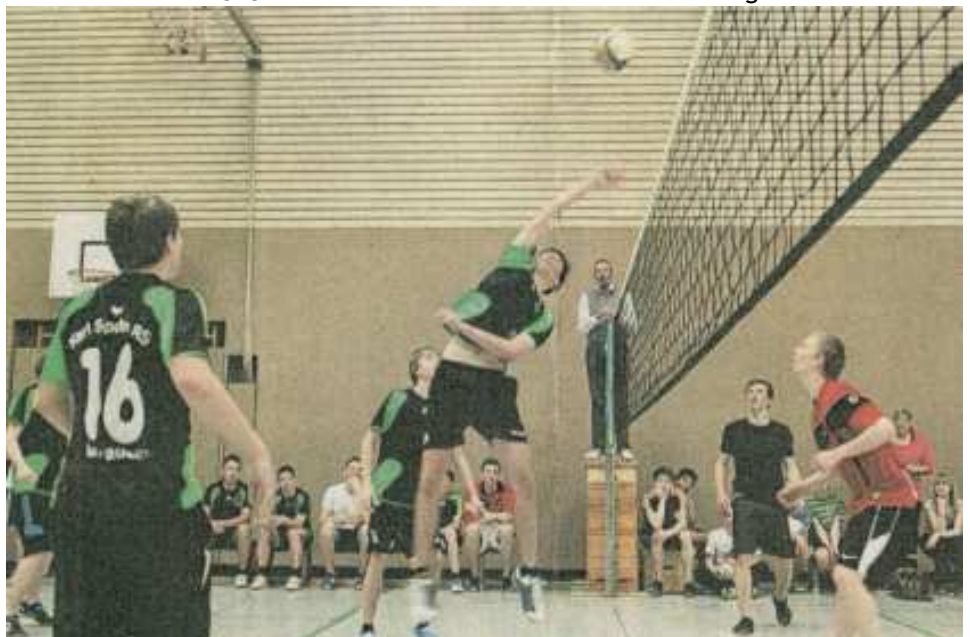
Das erfolgreiche KSR-Team beim Angriff